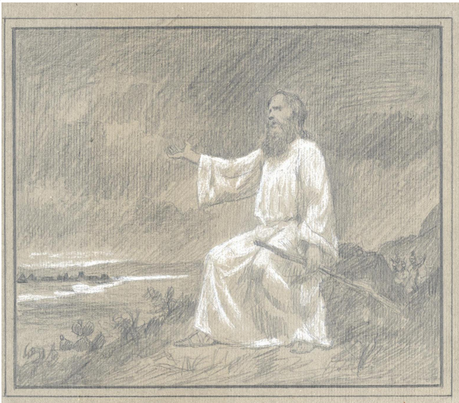
Illustration 2: Mateo Herrera, esquisse réalisée pour le concours de peinture d'août 1894.