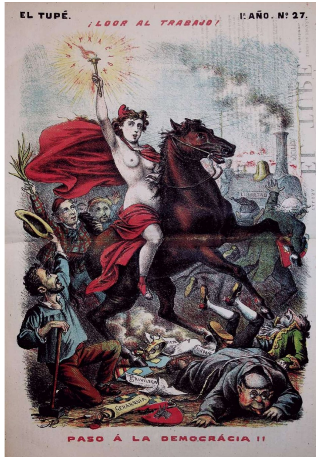
Ramón Puiggarí, ¡Llor al Trabajo! , El Tupé , 15/12/1881, Biblioteca General « Reina Sofía » (Universidad de Valladolid)