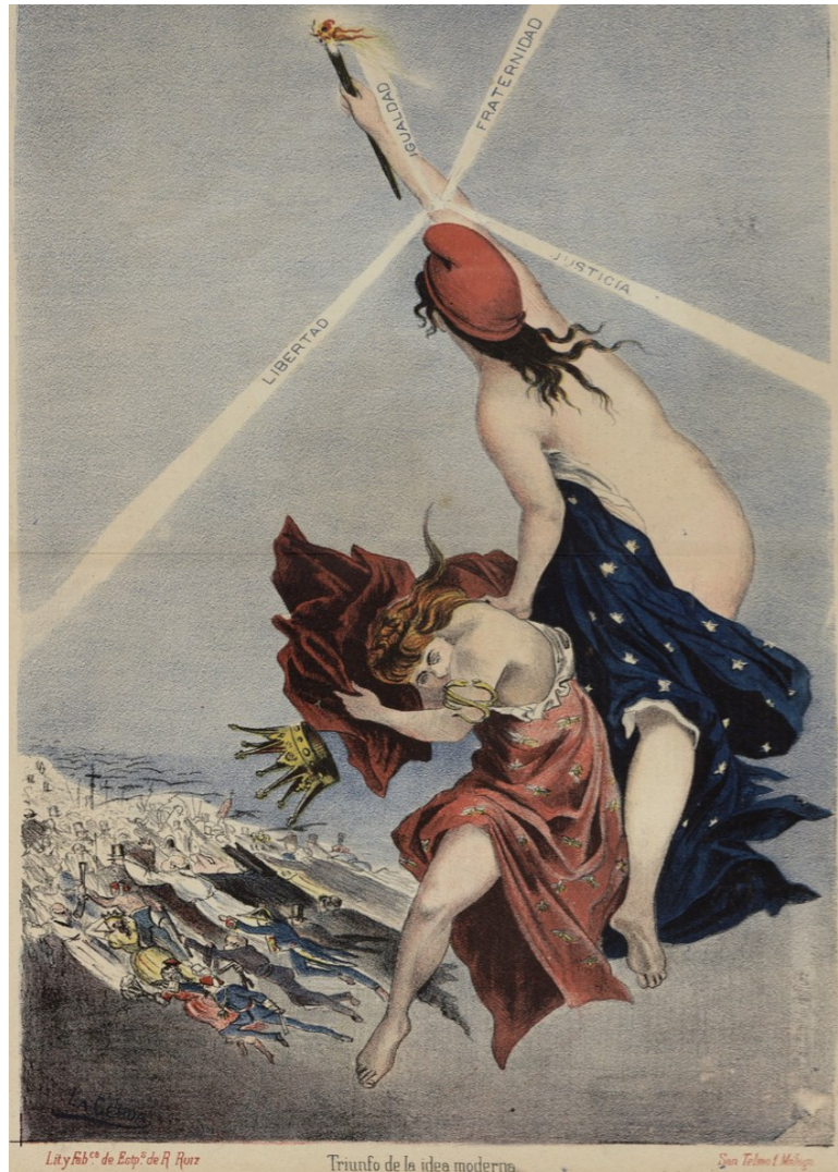
Emilio de la Cerda, "Triunfo de la idea moderna", El País de la Olla , 19/02/1883, Hemeroteca Municipal de Madrid.