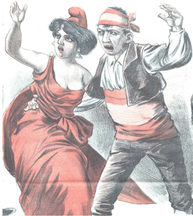
Don Quijote, 7/02/1902, Biblioteca Nacional de España