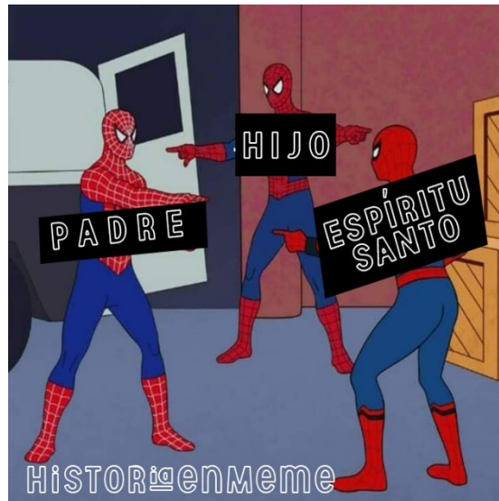
PÁGINA 6, ILUSTRACIONES 2, 3 Y 4: MEMES TOMADOS DE FACEBOOK Y TWITTER