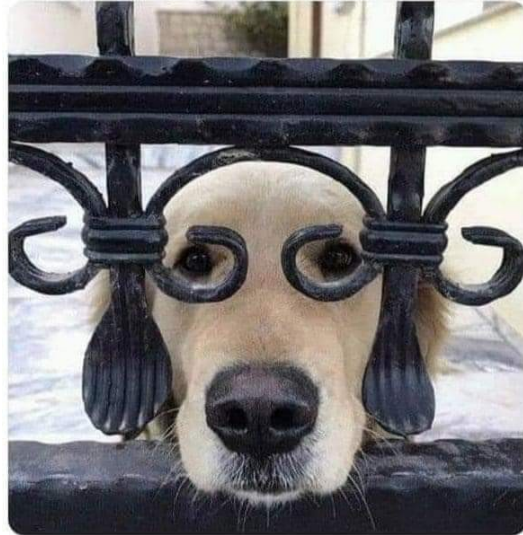
Francisco de Quevedog