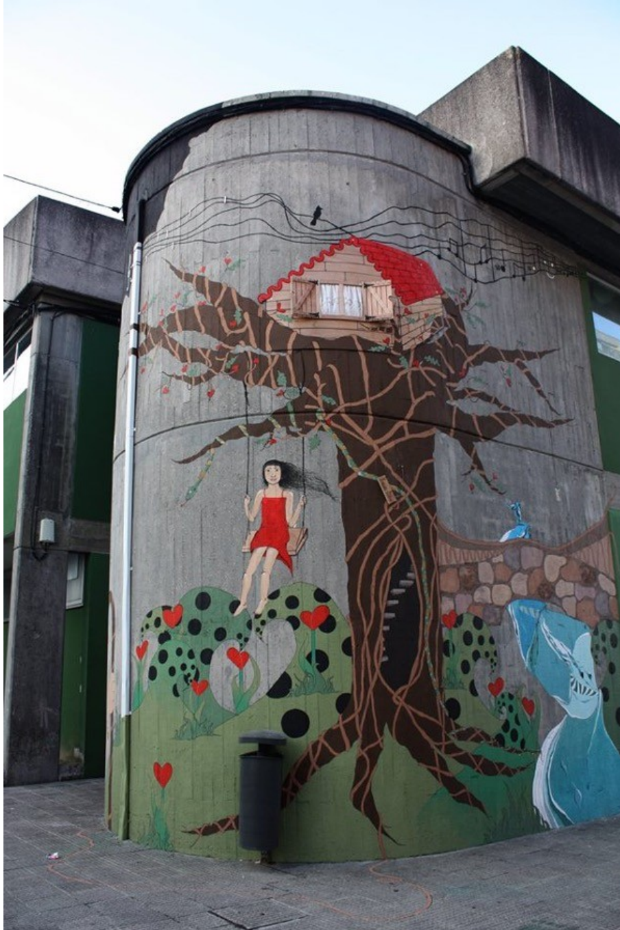
Illustration 2: Alita (muralista española), O paraíso de Eva , Proyecto "Derribando muros con pintura" en Carballo (Galicia), 2014