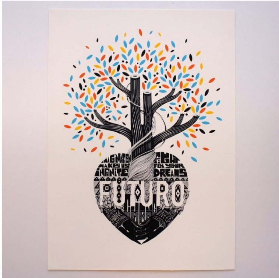
Illustration 3: Boa Mistura, Futuro , Serigrafía