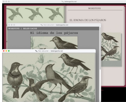
Illustration 1 : capture d'écran de l'interface de « El idioma de los pájaros ».